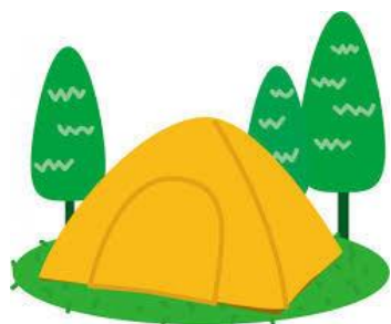
テント泊 森の中で設営します。